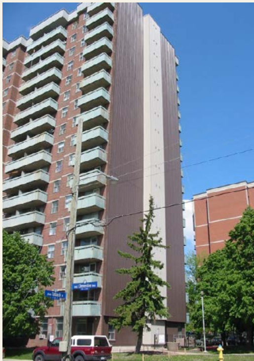
Figure 1 Clementine Towers

Construit en 1973, l'immeuble Clementine Towers (figure 1) comporte 258 logements répartis sur 17 étages qui sont principalement occupés par des personnes âgées. Le revêtement original était composé d'un placage de brique isolé et d'une cavité de drainage. En 2011, après près de 40 ans, le revêtement original s'était détérioré et devait être remplacé : détachement de joints de mortier, corrosion de cornières d'angle et blocs manquants. Le mur de la façade sud de l'immeuble faisait 790 mètres carrés (8 500 pieds carrés) de superficie et offrait une orientation optimale par rapport au soleil.